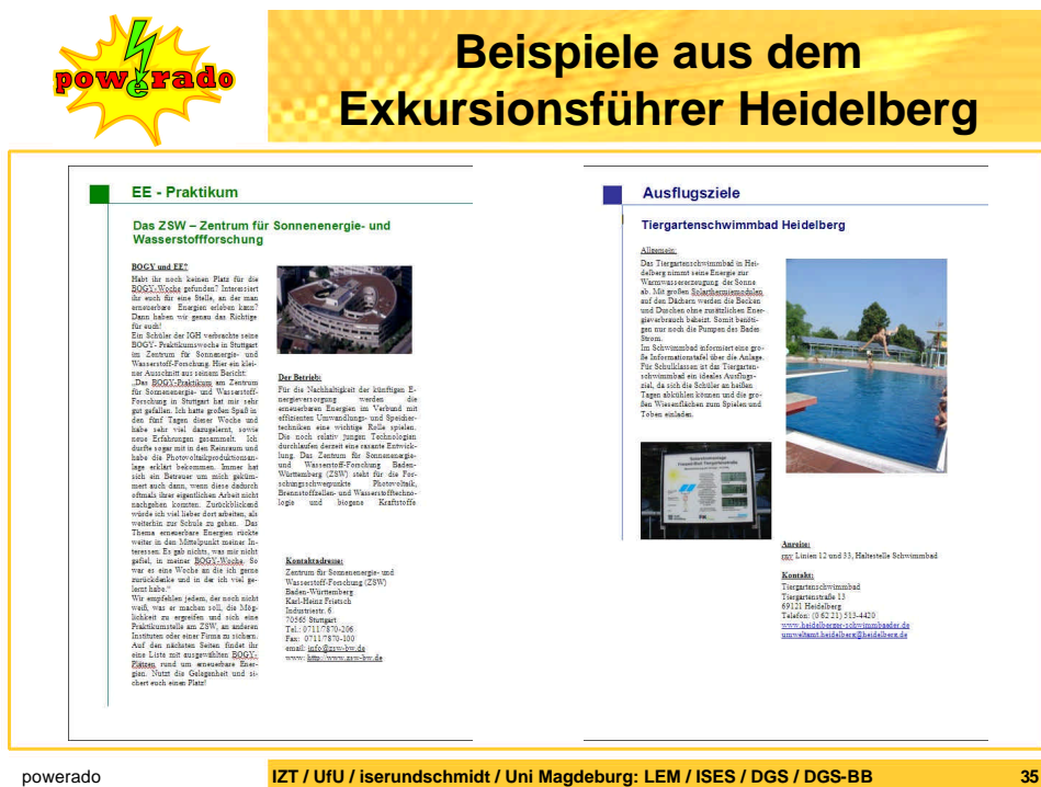
Abbildung 2: Auszug aus dem Exkursionsführer der Region Heide lberg