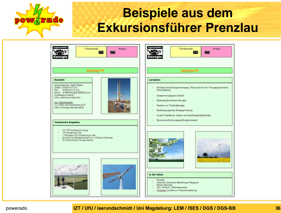
Abbildung 3: Auszug aus dem Exkursionsführer der Region Prenzlau