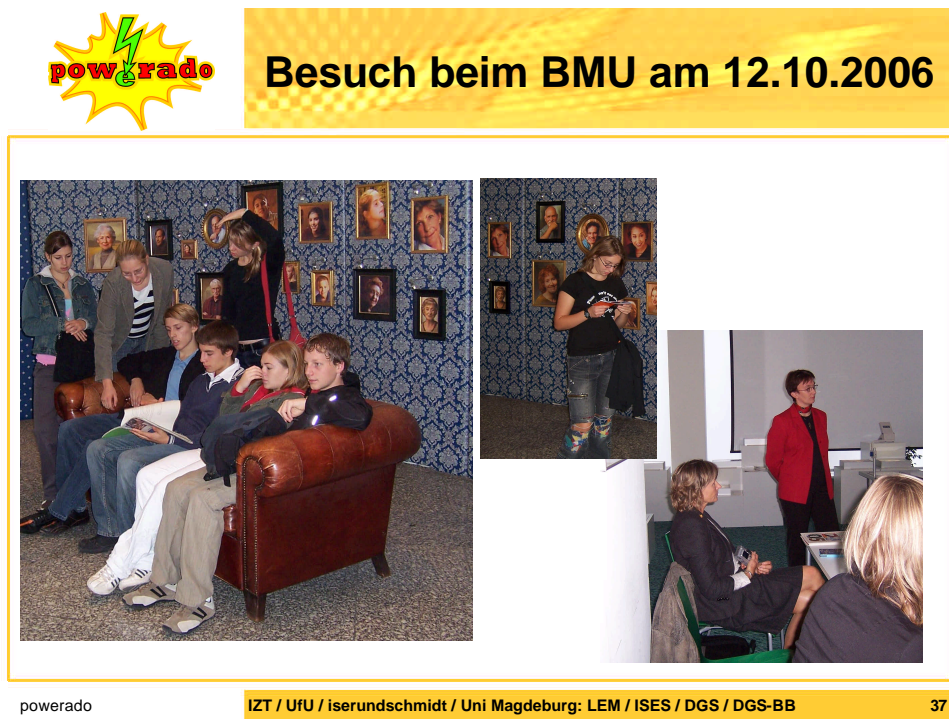
Abbildung 1: Vorstellung der Projekte und Ergebnisse im BMU

Beide Reiseführer wurden zum Herbst 2006 fertig gestellt und auf der Energiemesse Prenzlau (12.-14.10.2006) der Öffentlichkeit vorgestellt. Zu diesem Anlass besuchten die Heidelberger Schüler Prenzlau und Berlin. In einem Gegenbesuch in Heidelberg konnten die Prenzlauer Schüler ausgewählte Exkursionsziele des Heidelberger Reiseführers besuchen. Beide Besuche stellten den Höhepunkt des Projekts für alle Beteiligten dar. In Berlin stellten die Schüler am 12.10.2007 gemeinsam das Projekt und ihre Ergebnisse der Parlamentarischen Staatssekretärin Astrid Klug vor und diskutierten über das Potential Erneuerbarer Energien zur Gestaltung der eigenen (beruflichen) Zukunft.